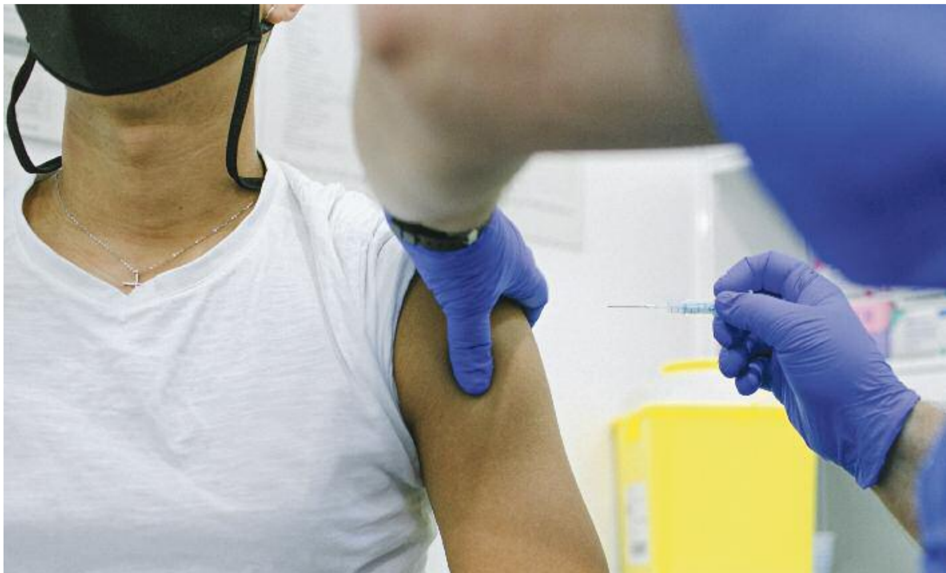
Algunes persones, malgrat tenir la pauta de vacunació completa, veuen disminuïda la protecció, sobretot davant de noves variants com l'òmicron.

► El Departament de Salut ha ampliat a una bona part de la població la vacunació de la dosi de record de la covid. En concret, ja la poden demanar totes les persones de 30 anys o més que van ser vacunades amb Pfizer o Moderna en la pauta completa, sempre que hagin passat 5 mesos des que la van rebre. També se la poden posar tots els joves d'entre 18 i 29 anys que van rebre la pauta completa d'aquestes mateixes vacunes 8 mesos enrere.