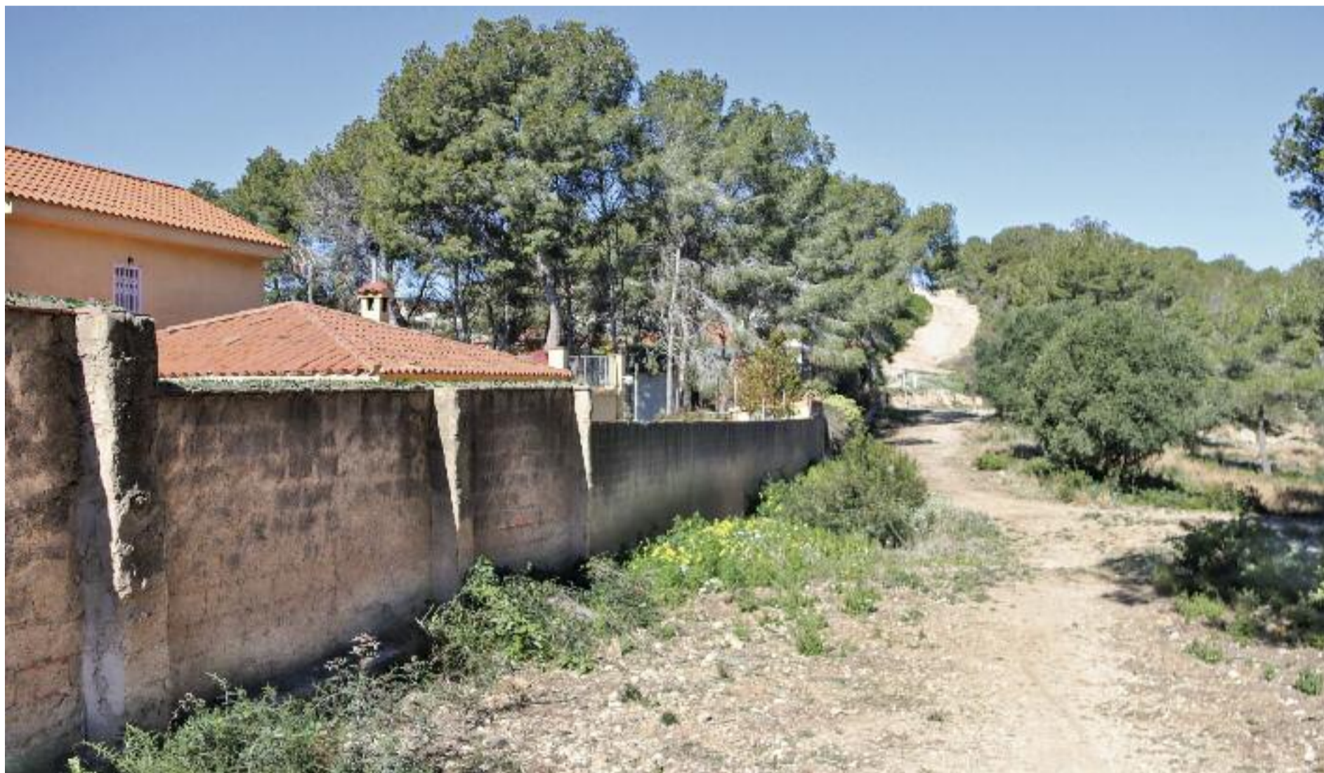
Imatge d'una franja perimetral d'una urbanització.

PREVENCIÓ ▶ Si bé la sequera ens ha posat al límit, hi ha diversos canvis socials que han augmentat progressivament el risc d'incendis als nostres boscos. És per això que la prevenció, tant la dels professionals com la de la ciutadania, és vital per minimitzar aquest risc inherent associat al progrés.