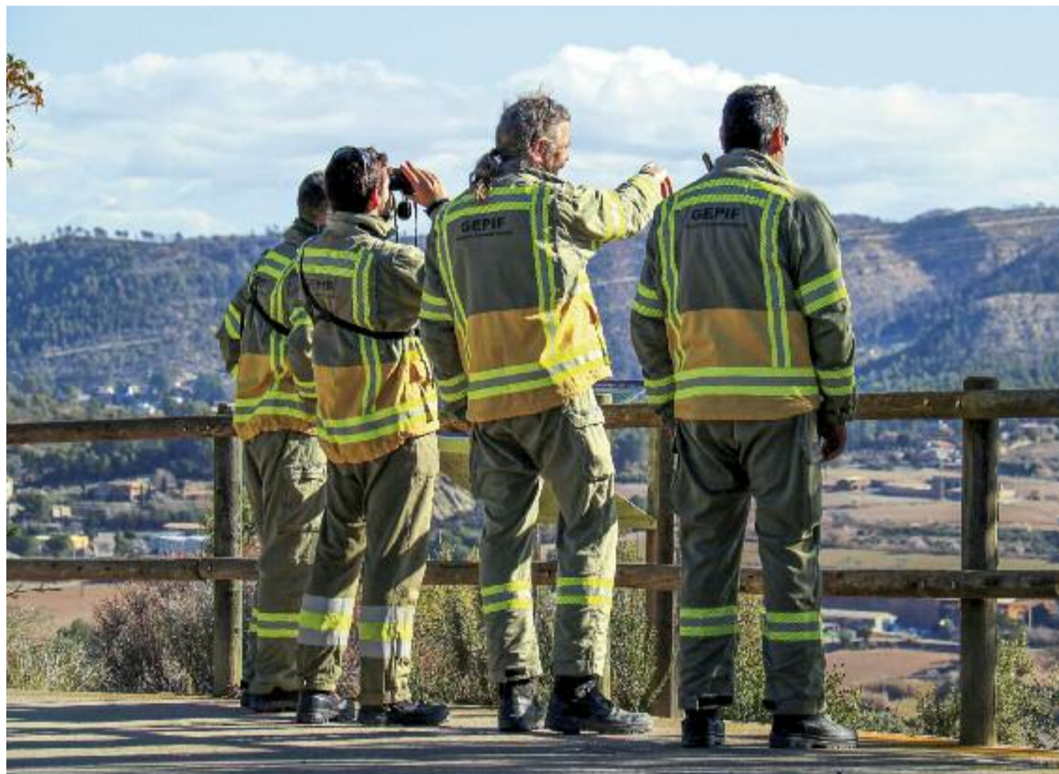
El Grup de Prevenció del Departament d'Acció Climàtica durant les tasques de vigilància.

Més enllà de la mortalitat de la vegetació, els experts adverteixen que moltes masses afec-